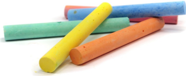
Renkli Boya Kalemleri (Cins İsim)

İçinde en az bir özel isim ve bir cins isim olan güzel bir cümle yaz.