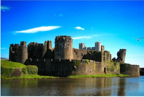
Kale tahkimatı: Merkezi olmayan feodal gücün bir sembolü.

▣ Bilgi Transferi: Orta Çağ kaleleri, merkezi olmayan bir dünyada fiziksel güvenlik sağlıyordu. Bunu günümüz siber güvenliğiyle karşılaştırın; 'sınırlama/hapsetme' stratejisi dijital çağımızda nasıl devam ediyor?