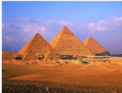
Şekil B: Mısır Piramitleri. Firavunlar için anıtsal mezarlar olarak inşa edilmiştir.

8. Şekil A ve B'ye dayanarak, bu iki anıtsal yapının temel amaçlarını karşılaştırınız.