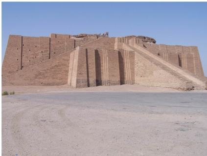
Şekil A: Mezopotamya Zigguratu. Tanrılar ve toplum için inşa edilmiştir.